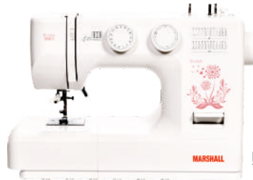
Elisa 850 S/max