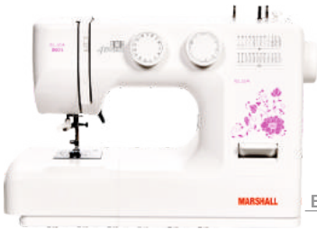
Elisa 860 S/max