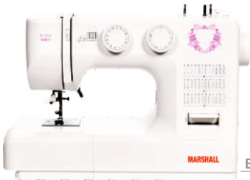
Elisa 990 S/max