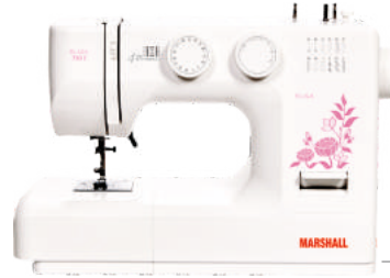
Elisa 730 E