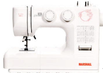
Elisa 980 S/max