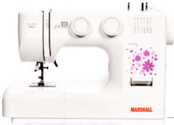
Elisa 740 E